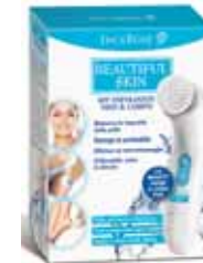
KIT ESFOLIANTE VISO E CORPO