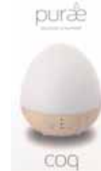
DIFFUSORE PER OLII ESSENZIALI