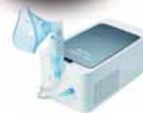
PRONTEX ATOMO AEROSOL

con 400 punti potrai scegliere uno di questi prodotti