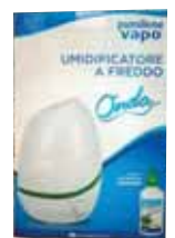
UMIDIFICATORE A FREDDO