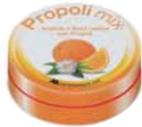
CARAMELLE PER LA GOLA