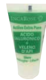
SIERO LIFTANTE INCAROSE