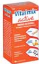
INTEGRATORE VITAMINICO ENERGIZZANTE