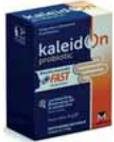
FERMENTI LATTICI PROBIOTICI